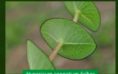
Hypericum connatum folhas