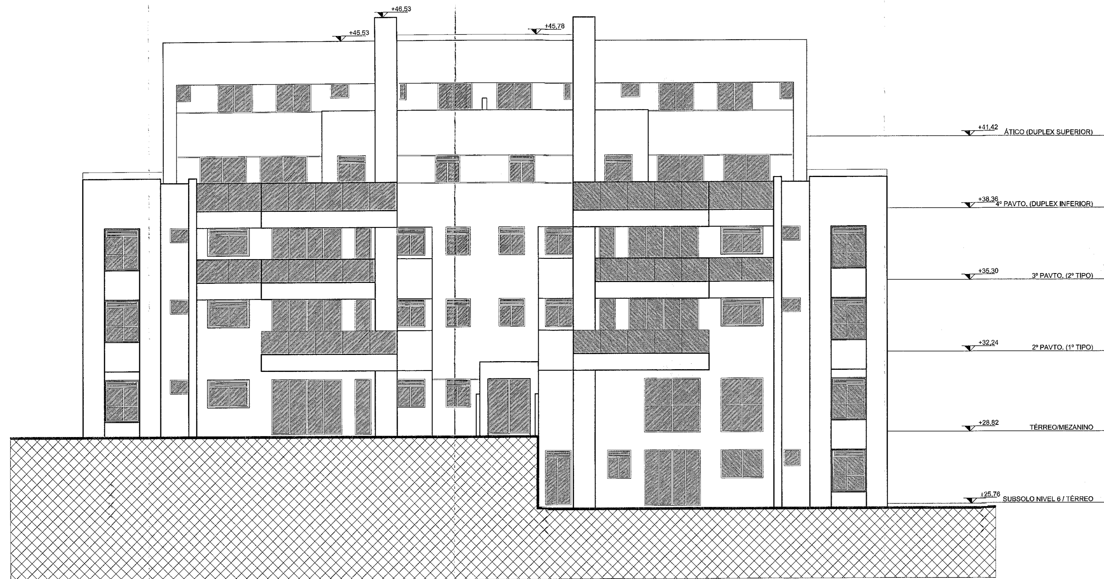
ELEVAÇÃO 01 TORRE 4