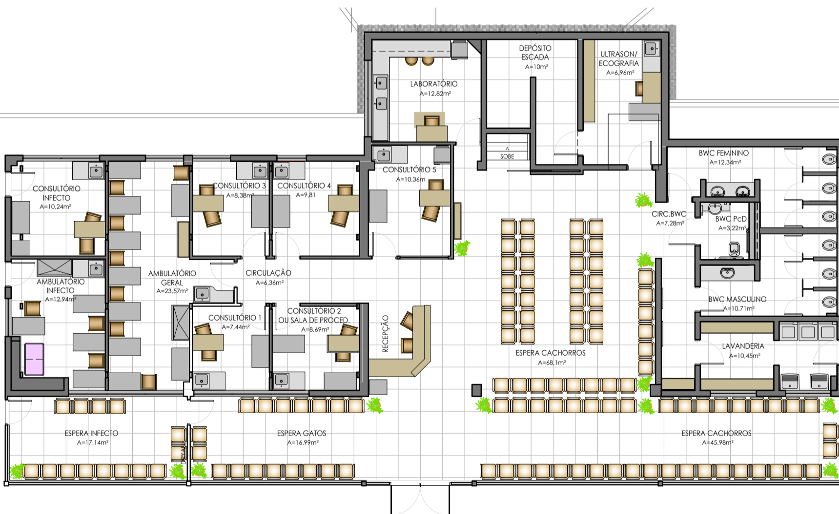
PAVIMENTO TÉRREO ESCALA: 1/125 ÁREA 364m 2