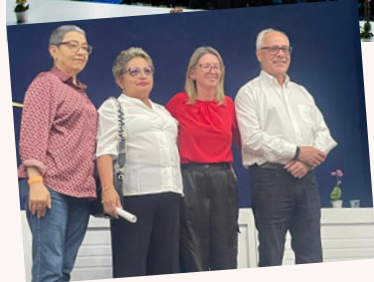
CMS participa da cerimônia de conclusão do Curso Mais Saúde com Agente - 294 ACS e ACE da SMS formados