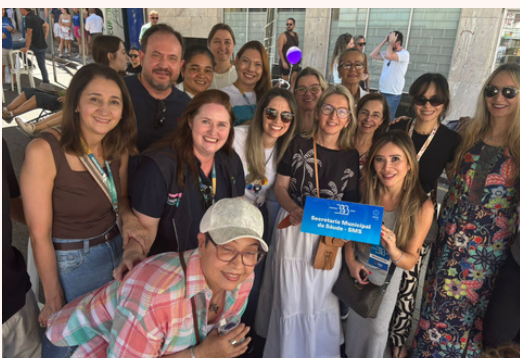
No dia do aniversário de Curitiba (29/3), Saúde em Ação no Domingo no Centro. CMS presente!