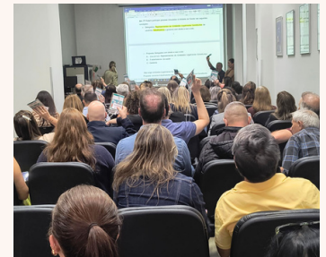
Alguns momentos do importante debate para aprovação do regimento e regulamento das Plenárias e Conferência de Saúde. Parabéns conselheiros!